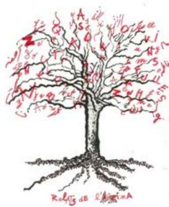
Associació “Relats de l’Alzina”

Creació de la Associació “Relats de l’Alzina”